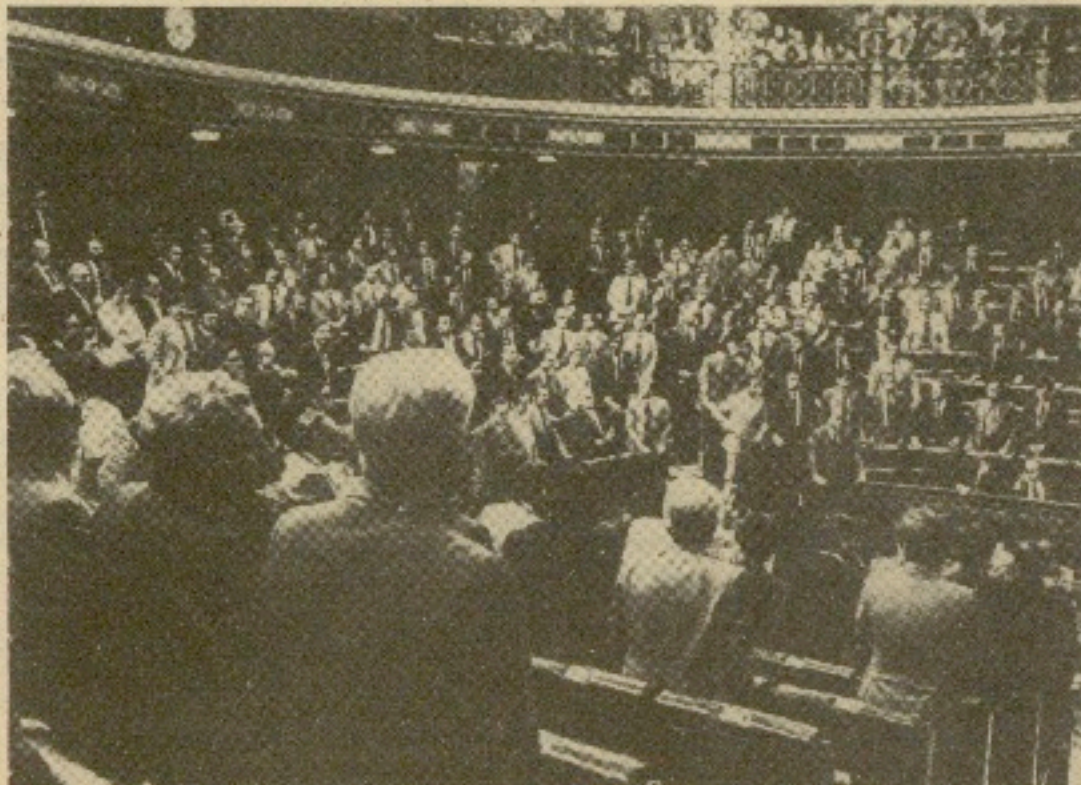
En el Congreso de Diputados fue aprobada ayer por unanimidad una propuesta hecha por todos los grupos parlamentarios condenatoria de los recientes atentados perpetrados en el País Vasco. Todos en pie, los diputados, como muestra la fotografía, dieron su apoyo a la moción.