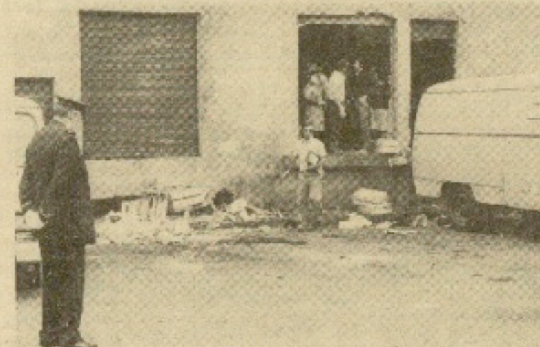
Lugar donde se cometió el atentado, junto al mercado de frutas de Atocha.

informarnos de que tres jóvenes que fueron localizados con un hacha fueron detenidos. Trataban de cortar un árbol, pero en los primeros momentos y a distancia parecía que llevaban una ametralladora. Otro grupo de jóvenes también fue avisado por las fuerzas que cercaban esta zona, siendo detenidos, porque al parecer un camionero avisó que llevaban metralletas, siendo más tarde puestos en libertad. Falsas alarmas que obligaron a diseminarse a las fuerzas en varias direcciones, con lo que se logró la detención de tres de los cinco individuos que cometieron el atraco en Hernani.